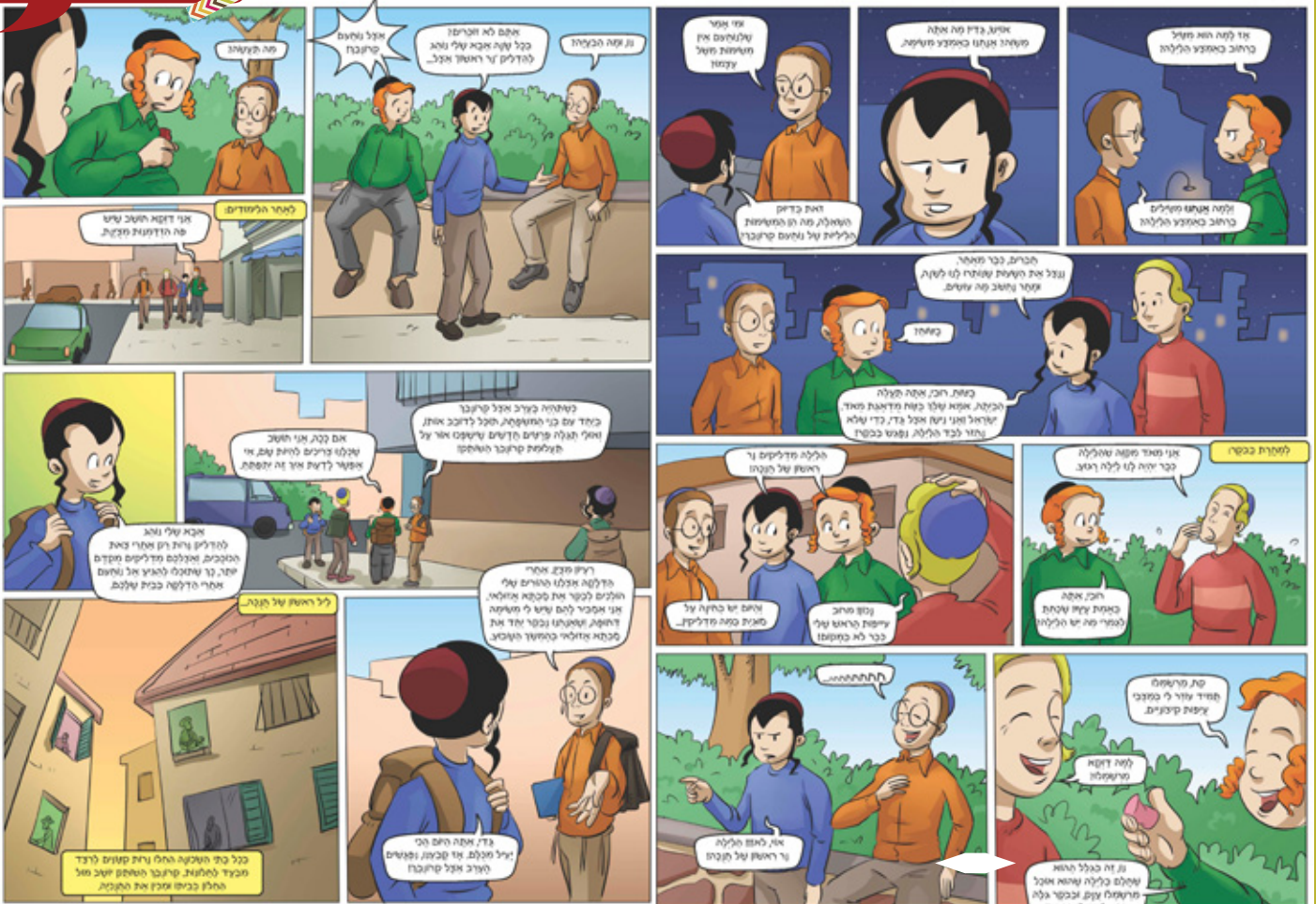
המשך בשבוע הבא...

הצטרפות למגזין החודשי או לרישימת מגזין מוצרי חבורת תרי"ג, היכנסו לאתר הידברות שופוס או חייגו: 073-222-12-50